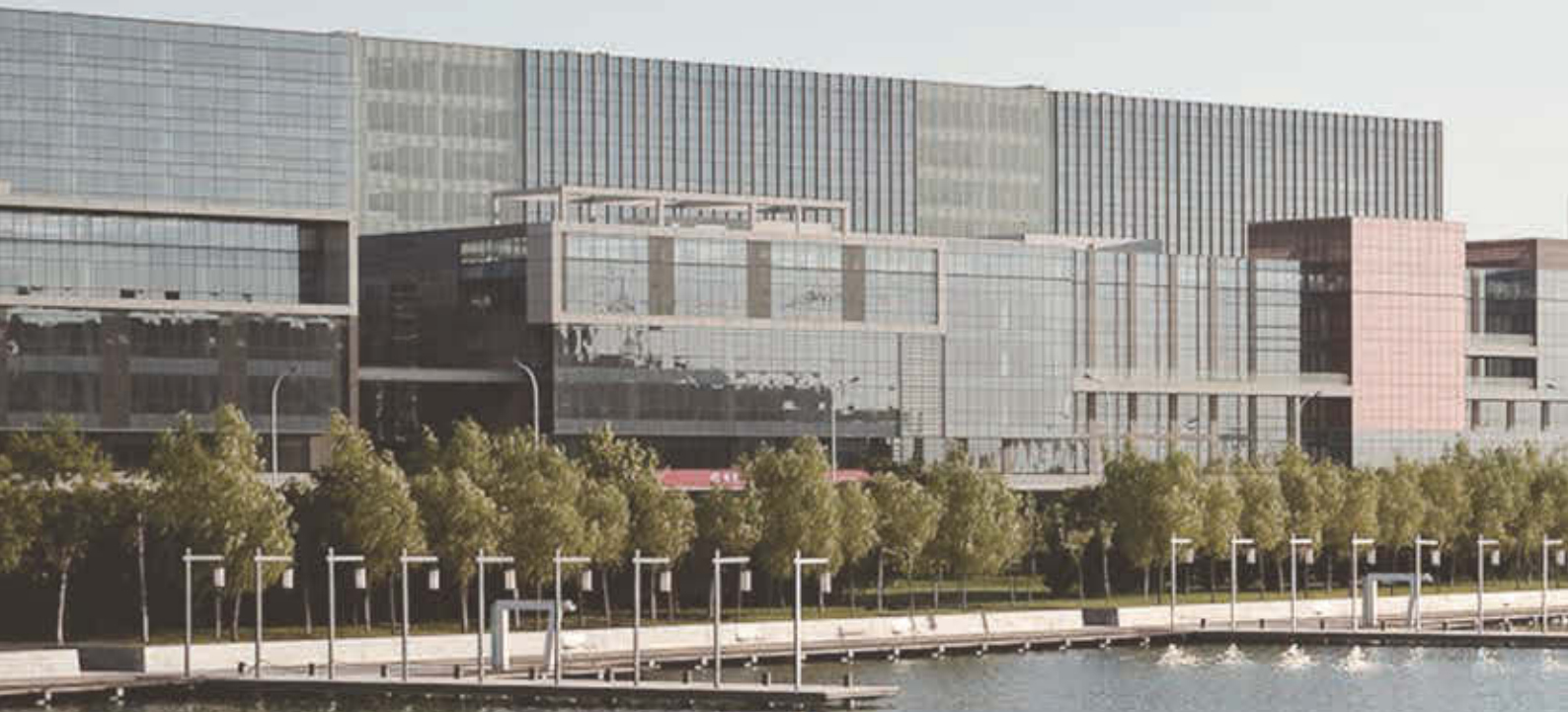
天津機場經濟區 Tianjin Airport Economic Zone